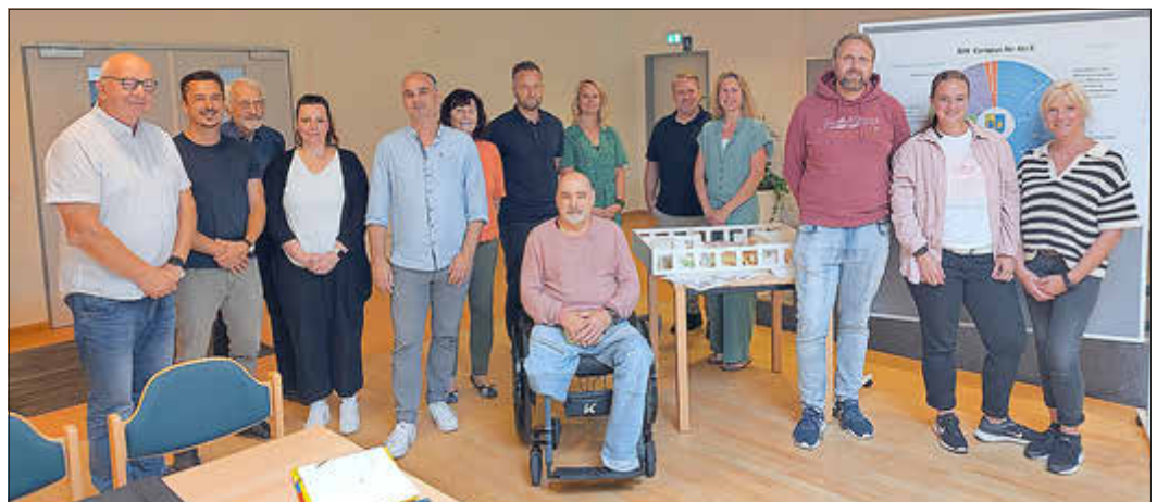
„Auftakt Objektplanung“ für den Gemeinde- und Bildungscampus Gemeinde, Amt Warnow-West, Projektsteuerer, Objektplaner, Kita, Schule, Hort, LSG Elmenhorst e.V., Serviceagentur „Ganztäglich Lernen“, Behindertenbeauftragter, Schulsozialarbeit

kann, soll bis zum Ende des Jahres u.a. das Raumkonzept fertiggestellt sein, um bei den Fördermittelgebern erfolgreich berücksichtigt werden zu können. Der aktuelle Entwicklungsstand zum Campus wird fortlaufend in den Sitzungen des Sozialausschusses und in der Einwohnerversammlung im November vorgestellt.