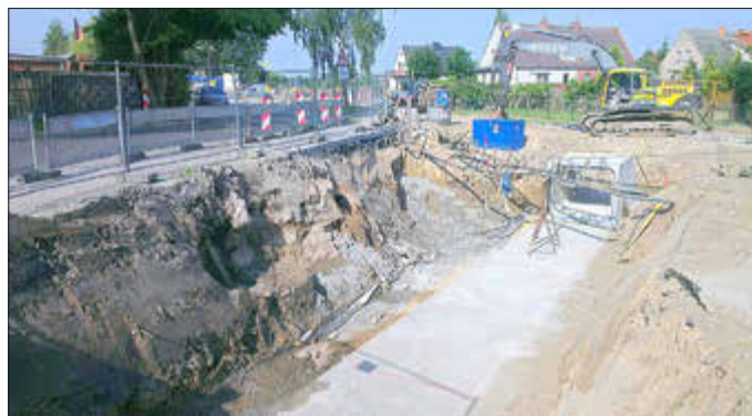
Ausbau Kreuzung Dorfstrasse

Doch auch die Detailarbeit war mit Herausforderungen verbunden. Die Gemeinde mussten den Eigenanteil der Investitionen von immerhin 230 T€ sicherstellen. 26 Eigentümer waren zu überzeugen, von ihrem Land Flächen für den neuen Verlauf der Rotbäk bereitzustellen und sich mit Ausgleichsflächen zufrieden zu geben. Gerade diese Aufgabe erforderte Geduld und viel Zeit. Wer mag,