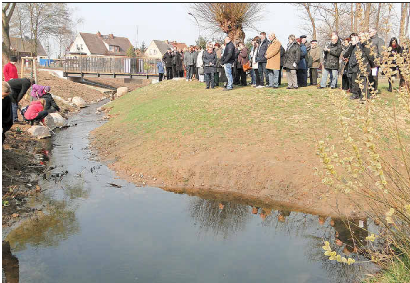
Eröffnung renaturierte Rotbäk