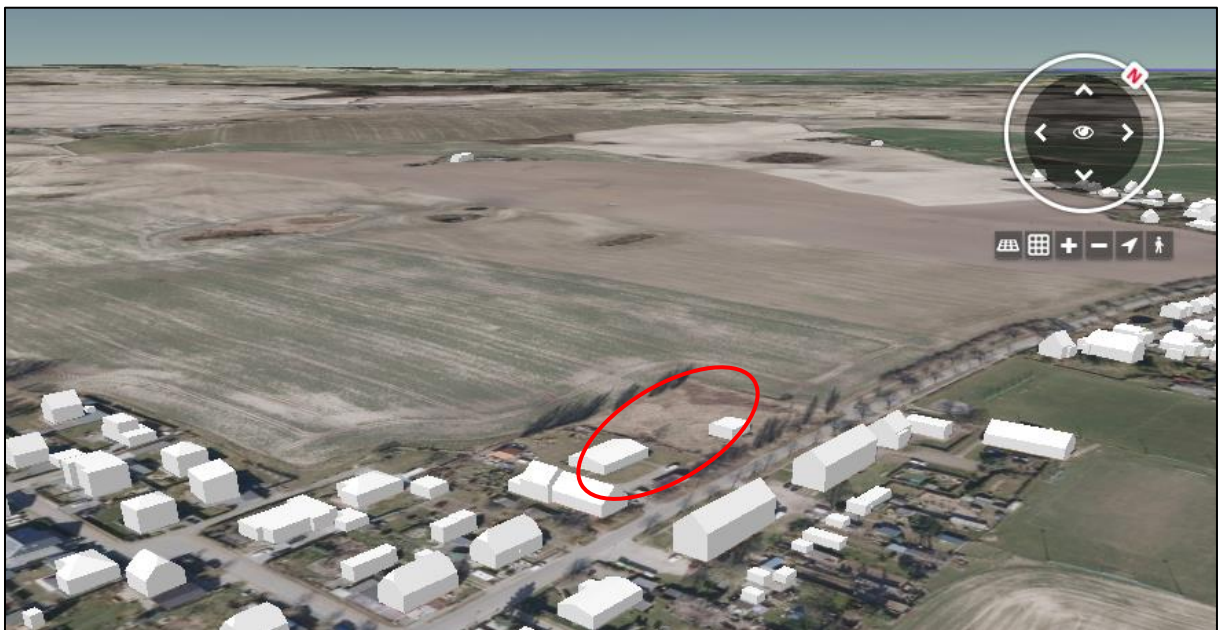
Abbildung 1: Virtual CityMap

Auf der gegenüberliegenden Straßenseite befinden sich weitere Wohnnutzungen sowie die örtliche Feuerwehr.