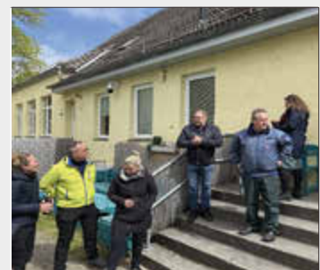
-Ansprache des Bürgermeisters-