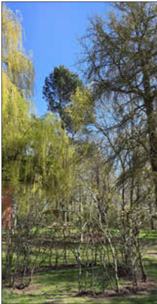
Weidentipi Kita Sonnenkäfer