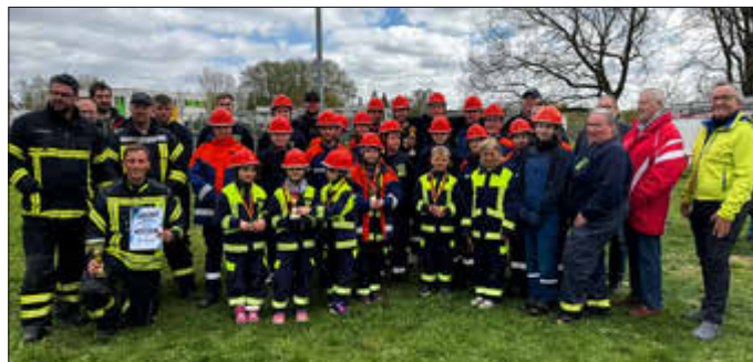
Amtsausscheid der Feuerwehren

wehren im Amt Warnow-West eindrucksvoll unter Beweis stellte.