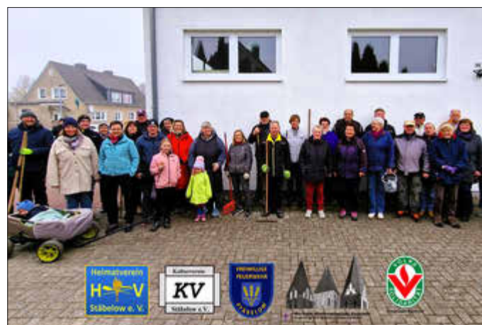
Teilnehmer Frühjahrsputz in der Gemeinde Stäbelow

Vielen Dank an alle großen und kleinen Helfer!