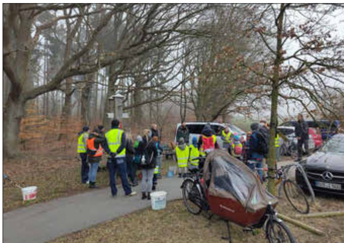
Waldputz- und Strandputztag