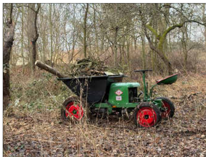
Dumper beim Frühjahrsputz der Gemeinde