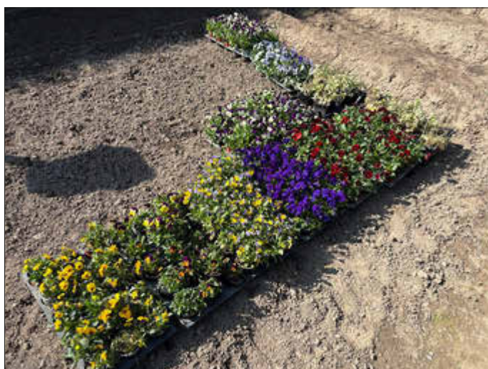
Blumen vom Gärtner