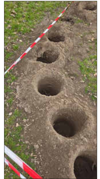
Pflanzlöcher für das Tipi

Nun heißt es warten, bis unser Dom richtig grün zuwächst und ein toller Schattenspende und Rückzugsort für die Kids wird. Schon jetzt versteckt sich das ein oder andere Kind hinter den dünnen Zweigen und wird dann doch entdeckt.