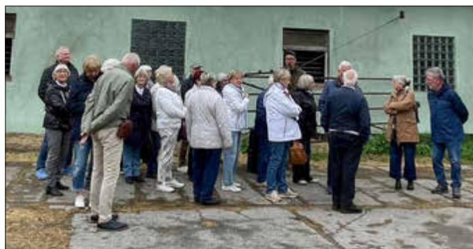
An den Stallungen