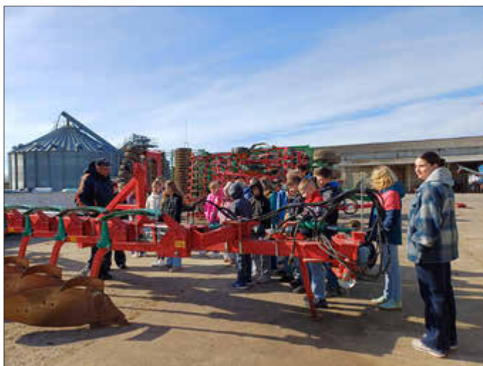
Schüler der 5. Klasse