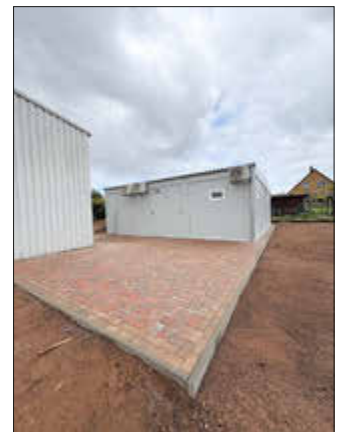
Errichtung der Raummodulanlage als Sozialtrakt