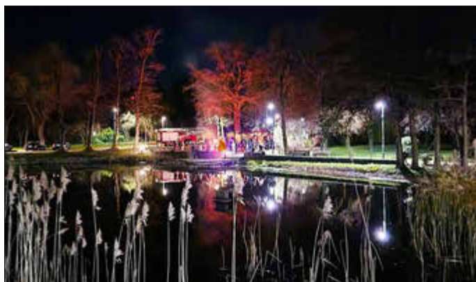
Osterfeuer 2026 Stäbelow

Die Veranstaltung verdeutlichte einmal mehr den starken Gemeinschaftssinn in Stäbelow und das große ehrenamtliche Engagement aller Beteiligten.