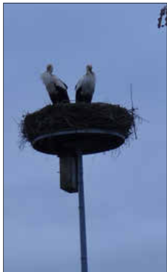
Das Storchennest in Sildemow

Text und Bilder: Sozialausschuss und VS Niendorf-Groß Stove und Gemeinde Papendorf