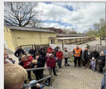
-die fleißigen Helfer-